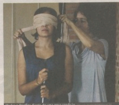
Medos e desafios diante de uma nova condição

No Oi Futuro (av. Afonso Pena, 4.001 – Mangabeiras). Hoje, às 15h (sessão especial com audiodescrição para deficientes visuais) e às 20h (sessão para o público em geral). Entrada franca.